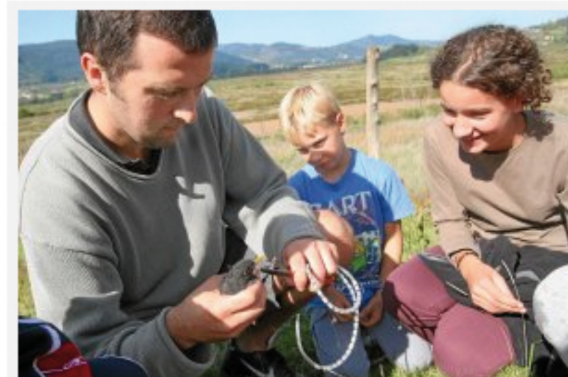
Un ornitólogo del Urdaibai Bird Center anilla un pájaro junto a varios alumnos de la zona.

El estudio de las aves forma parte del calendario escolar de las escuelas Montorre y Urretxindorra desde hace cinco años. A lo largo del curso , los alumnos analizan los tres periodos básicos en la vida de un ejemplar: la invernada, el periodo de cría y la emigración. Cada centro afronta estas etapas con un trabajo de campo en el que los niños participan activamente con la colocación de nidos, la instalación de comederos y la recopilación de datos sobre las especies que han avistado. «Aprenden divirtiéndose y muchos de ellos serán los futuros ornitólogos», vaticinaron los promotores.