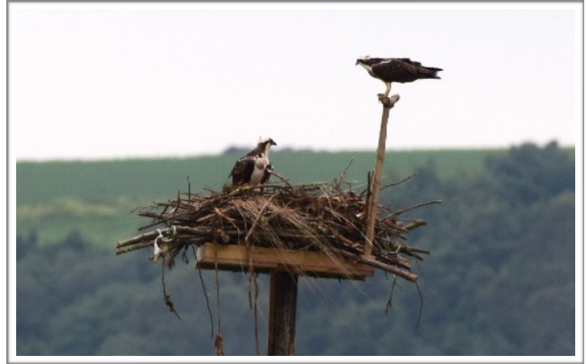
Izda: P1 (2013) fotografiado a su llegada en marzo a Urdaibai . Dcha: P1 emparejada en la Bahía de Santander