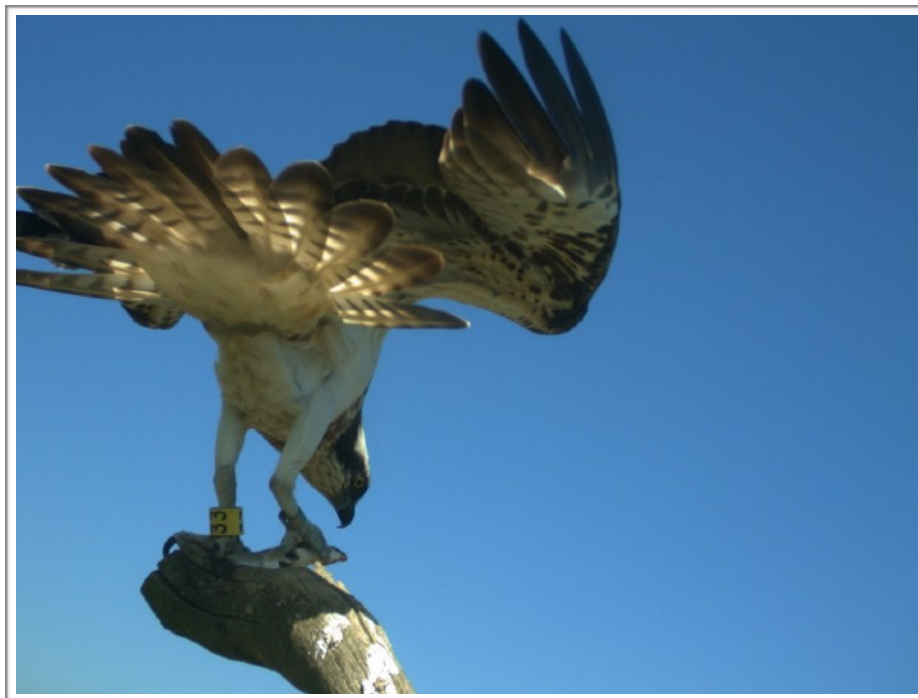
33(2015) foto-trampeado en la Reserva de Urdaibai

Fotografiado en Urdaibai el 24 de Mayo. Observada regularmente en Villaviciosa (Asturias) entre el 22 de Junio y el 13 de Setiembre.