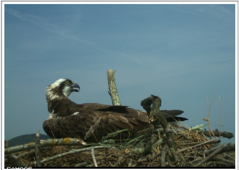
N3 (2013) en la Reserva de la Biosfera de Urdaibai