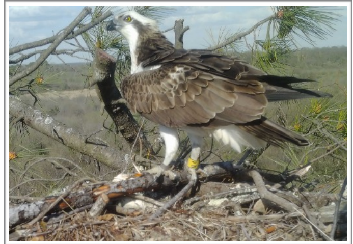
N4 (2013) junto a la hembra procedente de Córcega (CCE, Verde)