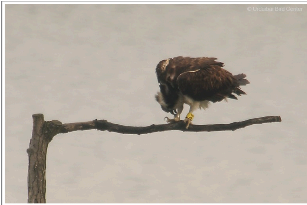
34(2015) fotografiada en la Reserva de Urdaibai

Fotografiada en Urdaibai el 22 de Junio y observada en Villaviciosa (Asturias) entre los días 2 y 4 de Julio.