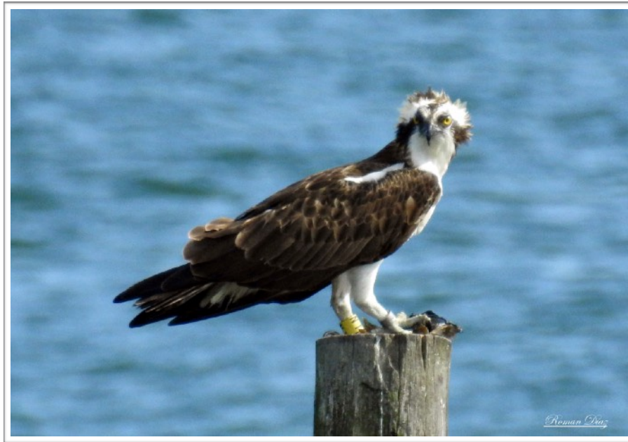
NT(2015) en la Bahía de Txingudi

Observado en la Bahía de Txingudi (Gipuzkoa, País Vasco) los días 15, 16 y 17 de Mayo.