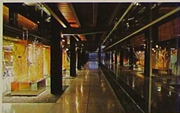
GOIAN, ORUETAKO AINTZIRA ETA PADURAK. BEHEAN, UBCKko INSTALAZIOAK.

Oso ohikoa izaten da mokozabala, lertxuna, ubarroia, martin arrantzalea edo kuliska iluna bertatik bertara ikustea. Urdaibai Bird Centerren datorren bisitariak espezie horiek guztiak ondoko behatoki hauetatik edukiko ditu ikuskai: